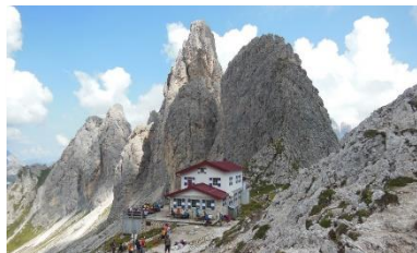
Rifugio Fratelli Fonda Savio